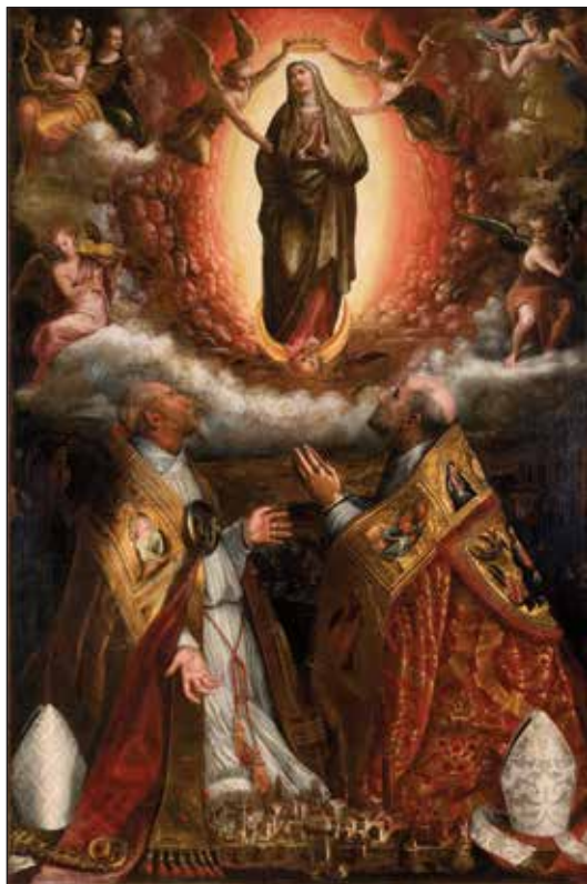
Madonna di Ponte Santo

in nicchia dei protettori della città. Da sinistra sono rappresentati i santi Cornelio, Proietto, Maurelio, Biagio, Terenzio e il