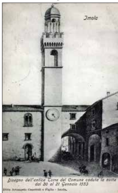
Antica torre comunale Bim, Fondo iconografico

vita allo sviluppo della pubblica piazza. Il primo importante ampliamento del Palazzo Comunale avvenne con l'acquisto di alcune proprietà private, fra cui la casa-torre del nobile Cacciaguerra dei Marescotti (1230) posta all'incrocio fra le vie Emilia e Appia. La torre dei Marescotti divenne la prima torre comunale e il palazzo divenne il "Palazzo nuovo" del Comune, mentre l'altro iniziò a essere denominato "Palazzo vecchio". Già nel 1255 le due sedi erano collegate da un ponte sulla via Emilia, forse coperto da una tettoia.