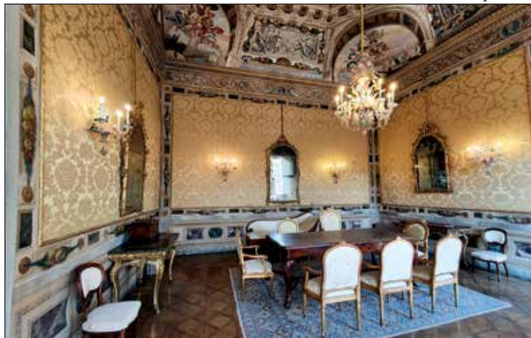
Sala gialla

“Sala gialla” – Al centro della finta cupola a cassettoni dipinta sul soffitto è sospesa la figura della Sapienza, simboleggiata da una torcia, un libro aperto e alcune corone di alloro e quercia in mano a un putto. Il basamento della volta è decorato da quattro finti rilievi monocromi che raffigurano episodi tratti dalla storia antica: Giulio Cesare saluta la madre prima