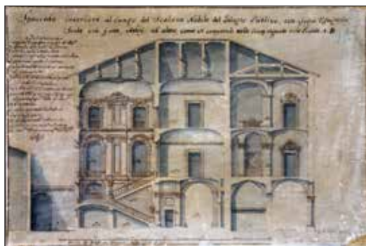
Spaccato del Palazzo Comunale nel progetto di A. Torreggiani Bim, Fondo iconografico

magistrature di popolo di nuova istituzione bolognese. Al pianterreno, sotto il portico lungo la via Appia, vi erano delle botteghe di stoffe, carni e formaggi. Nelle stanze più interne