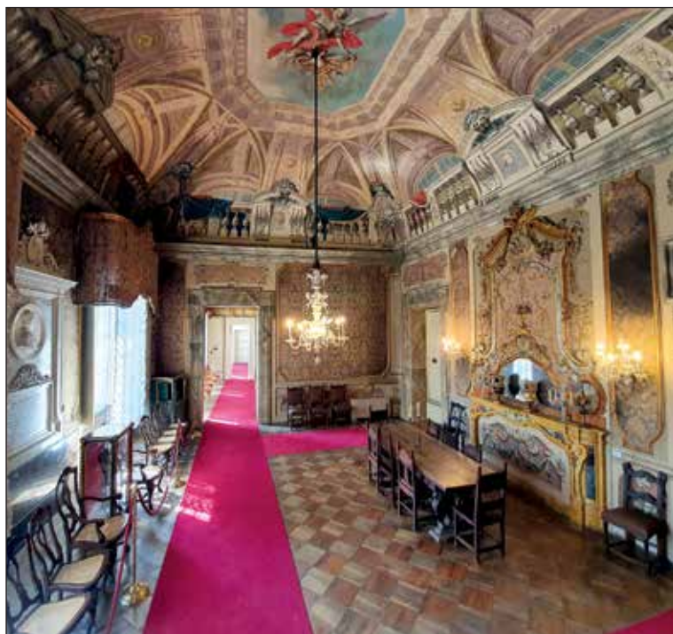
Sala del caminetto

Ritornando alla sala del centralino, si entra nelle sale che costituiscono l'“ Appartamento del magistrato ”, vero gioiello del palazzo. Le sale furono decorate già nel 1777 dai pittori Alessandro Della Nave, imolese, esperto in quadrature prospettiche, e da Giacomo Zampa, forlivese, che realizzò le figure. Fu ideato un programma iconografico ispirato alle doti del buon governo: giustizia, prudenza e sapienza, impersonate da altrettante figure allegoriche. Della Nave faceva parte del consolidato gruppo di artisti che, in quegli anni, lavorava a Imola nelle decorazioni di numerosi palazzi privati e di importanti luoghi pubblici in collaborazione con l'architetto Cosimo Morelli, tra cui la biblioteca comunale, insieme al pittore Antonio Villa, e la farmacia dell'ospedale di Santa Maria della Scaletta, insieme al pittore Angelo Gottarelli. I soffitti sono arricchiti da settecenteschi lampadari in vetro di Murano. “ Sala del caminetto ” - La volta si apre verso il cielo dove