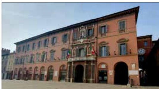
Facciata su Piazza Matteotti

La facciata esterna su piazza Matteotti, opera della stagione dei restauri della seconda metà del Settecento, è costituita da un fronte a tre piani. Osservando lo sviluppo delle finestre si può avere un'idea di come doveva apparire il fronte sulla piazza prima della realizzazione dell'attuale facciata: partendo dalla via Emilia, le prime cinque finestre corrispondono all'estensione del "Palazzo vecchio" medievale; le successive quattro alla canonica della prima chiesa di San Lorenzo, demolita nel 1480 da Girolamo Riario, signore di Imola e marito di Caterina Sforza; le ultime due alla seconda chiesa di San Lorenzo, ricostruita nel 1500 per volere papale e sconsacrata nel 1805. Tracce della struttura muraria del campanile sono ancora visibili nel cortile interno del palazzo. L'ingresso, che risulta asimetrico, è un portale a tutto sesto, adornato da quattro colonne con basamento a spigolo e capitello ionico, sulle quali poggia un balcone ondulato. Ai lati della finestra in due nicchie si trovano i dipinti dei santi protettori della città, Cassiano e Pier Grisologo, opera del pittore Gaspare Bigari. I dipinti furono commissionati nel 1774 dall'imolese Agostino Troni con un lascito testamentario, in cui