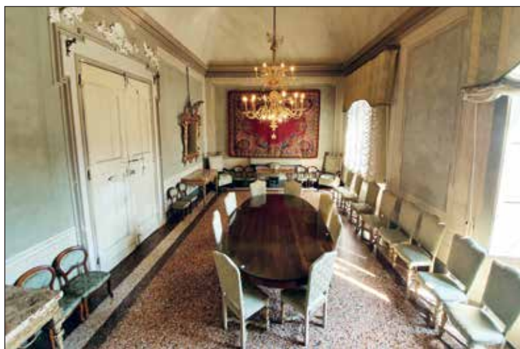
Sala verde - Archivio fotografico Comune di Imola

Tornando alla prima sala, si esce dalla porta sul fondo e, attraverso la "Sala del gonfalone", si entra nell'anticamera della sala consiliare, la cosiddetta " Sala verde ", che nel 1945 fu sede imolese del Comitato di liberazione nazionale (CLN). La stanza è arricchita dalla presenza di quattro grandi poltrone del secolo XVII, da una cornice dorata di stile rococò e da tre consolles in stile Luigi XVI. La " Sala del Consiglio " è rettangolare e "mossa" dal correre di una balaustra posta a circa 6 metri di altezza lungo tutto il perimetro. Le pareti sono decorate dai