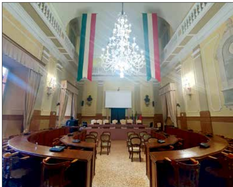
Sala del Consiglio

busti d'illustri uomini politici imolesi, Andrea Costa, Giovanni Codronchi Argeli, Giuseppe Scarabelli e Anselmo Marabini, e dalla lapide dedicata a Francesco Alberghetti, medico e filantropo imolese, scolpita nel 1859 dall'imolese Cincinnato Baruzzi, allievo di Antonio Canova. Una curiosità: dal 1798 al 1810 questa sala divenne temporaneamente il teatro della città dopo che, nel 1797 con l'arrivo dei francesi, un incendio aveva distrutto il Teatro dei Cavalieri Associati (costruito da Cosimo Morelli fra il 1775 e il 1782, in uno spazio a est della Port'Appia). Nella sala consiliare fu costruita una struttura in legno con 44 palchi su tre piani, un loggione, una platea con panche per il pubblico che non poteva pagare il posto nei palchi. La struttura fu demolita già nel 1807 poiché si temeva che un eventuale incendio avrebbe potuto distruggere anche l'adiacente archivio comunale, in cui erano conservati tutti i documenti ufficiali del comune. Nel 1812 fu inaugurato un nuovo teatro nella chiesa superiore dell'ex convento di San Francesco. Realizzato da un gruppo di cittadini imolesi, i Signori Associati, fu venduto al Comune nel 1846. Nella "Sala del Consiglio" si riunisce tutt'oggi il Consiglio comunale della città.