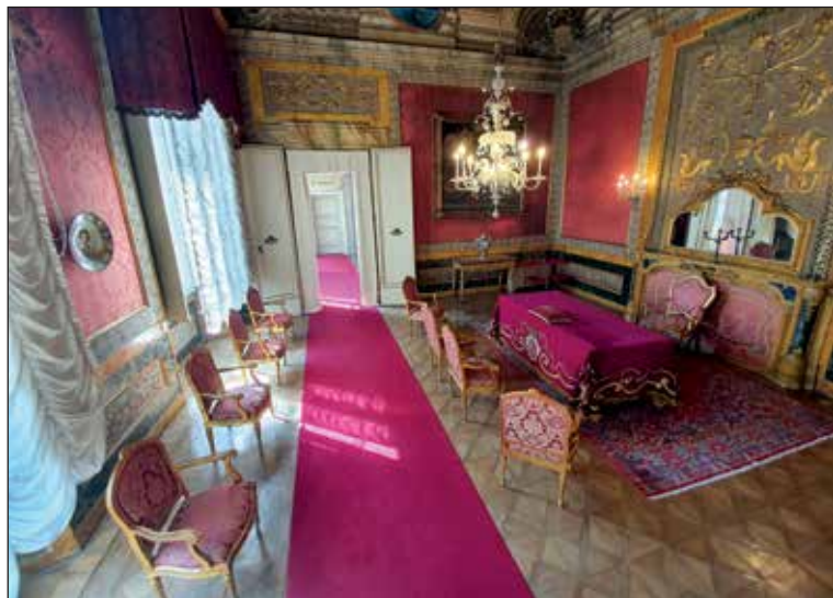
Sala dei matrimoni - Archivio fotografico Comune di Imola

“Sala rossa” o “Sala dei matrimoni” - Il soffitto è sfondato su un cielo pieno di nuvole, in cui volteggia l'allegoria della Prudenza, simboleggiata da uno specchio convesso, da una serpe, che rappresenta la coscienza, e da una corda, simbolo dell'inganno. Sul basamento della volta sono dipinti medaglioni, sostenuti da putti e contornati da drappi blu, che incorniciano finti rilievi con le allegorie delle qualità del buon governo