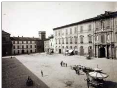
Palazzo Comunale e piazza all'inizio del '900

Purtroppo gli affreschi andarono perduti nel 1845 durante i restauri al voltone. Nei secoli XVI-XVII il voltone era utilizzato anche per le pubbliche impiccagioni, che avvenivano alla finestra in direzione Bologna.